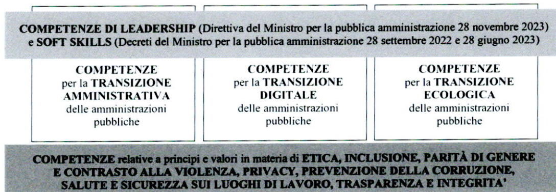
FIGURA 1 – Le aree di competenze trasversali del personale pubblico nella strategia del PNRR

La complessità dei processi di cambiamento che le amministrazioni devono promuovere e gestire richiede l’acquisizione, da parte delle persone, di conoscenze e competenze che attraversano tutte le diverse aree sopra individuate. Lo stesso termine “transizione” restituisce il senso di un mutamento radicale quale possibile esito di una pluralità di processi di cambiamento che agiscono sinergicamente.