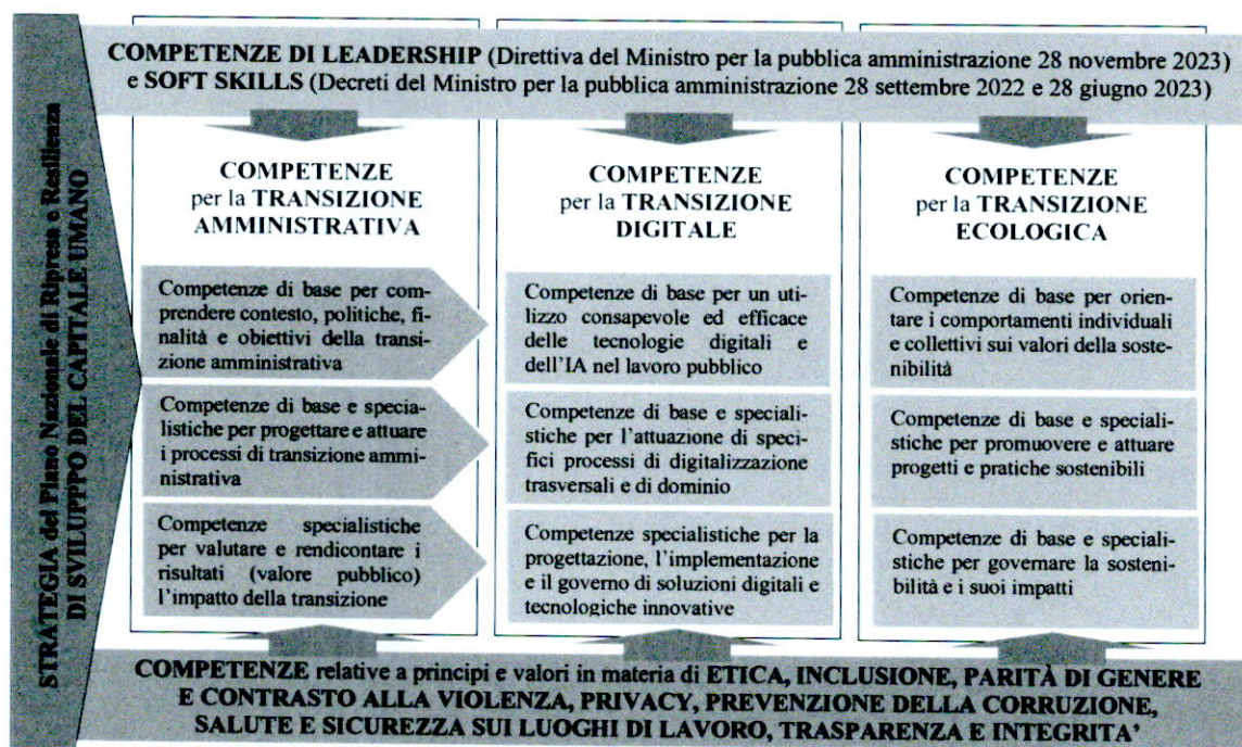
FIGURA 2 – Framework degli obiettivi di sviluppo delle competenze del personale delle amministrazioni pubbliche per la transizione amministrativa, digitale ed ecologica

In linea generale, all'interno di ciascuna area è possibile individuare almeno due diverse categorie di competenze che, generalmente, attengono a personale con ruoli diversi nei processi di trasformazione: